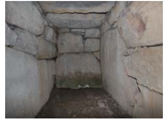
那波野古墳 (円墳) (県指定史跡)