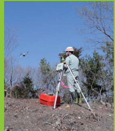
甲崎古墳測量調査風景 (2020年)