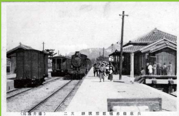
1918年頃的那波駅 (現相生駅)