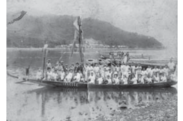
相生ペーロン (市指定無形民俗文化財) 写真は 1923 年