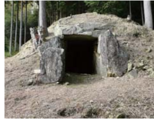
若狭野古墳 (方墳) (県指定史跡)