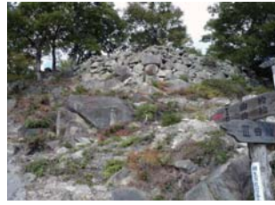
感状山城跡 (国指定史跡)